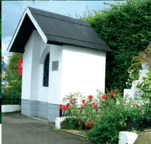
Kapel Sint Rochus

opgericht ter ere van de viering van het 100 jarig bestaan van de parochie Plombières.